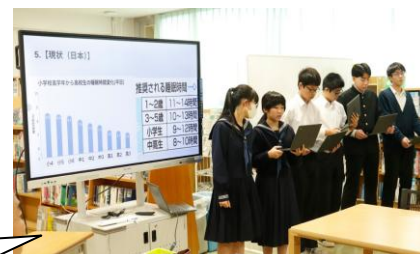
各教科等の年間授業時数